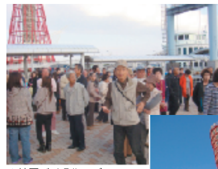
▲神戸ベイクルーズ

最後に神戸ベイクルーズで神戸港めぐりをし、海からの心地よい風と神戸の景観を船上から楽しみました。旅行を通じて、商工会員相互の連携強化や新たなコミュニケーションを図ることができ、有意義な1日となりました。大型バス2台で行くほどの大盛況で、皆様からも好評いただきました。また来年も楽しんで頂ける企画を考えていきます。