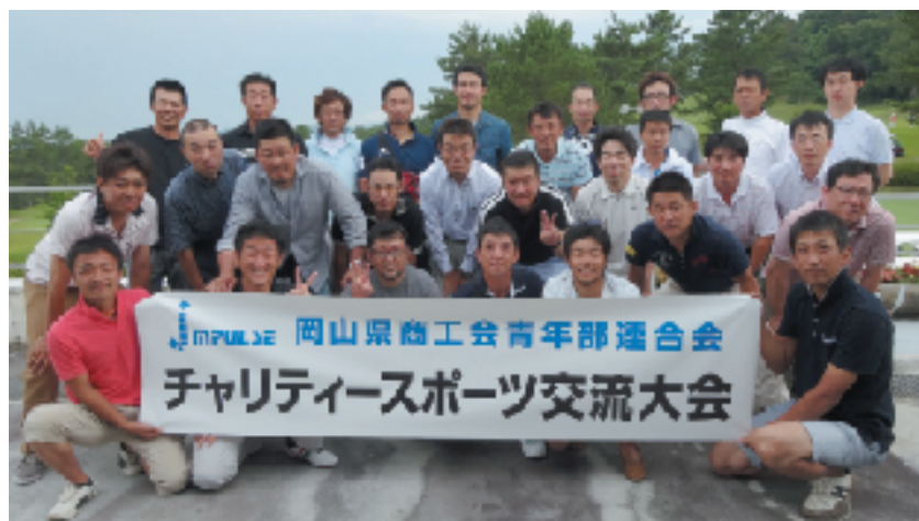
チャリティースポーツ交流大会に参加