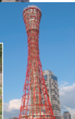
▲神戸ポートタワー