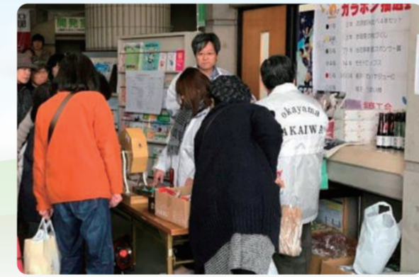
今回も抽選会は、大盛況でした「何が当たるかな～、わくわく！」