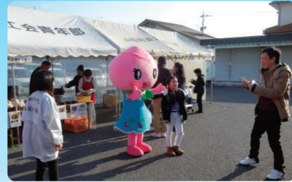
子ども大人もみんな大好き！あかいわモモちゃん

これからも赤磐商工会は、行政や企業、地域住民と一丸となって地域活性化のために貢献していきたいと思えます。