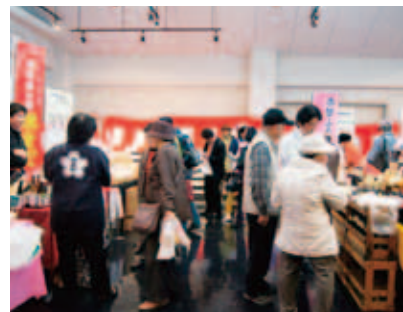
展示即売会場の様子

赤磐の特産品の試飲・試食、工芸品の展示即売会を実施します。さらに杵つき餅の実演販売や、焼栗、焼き鳥などたくさんのお店が並びます。