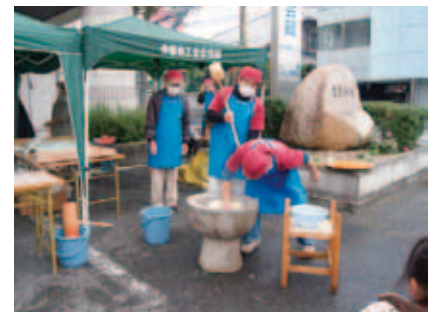
餅つき隊も来るよ!!