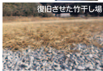
復旧させた竹干し場