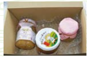
手作りジャム3点セット