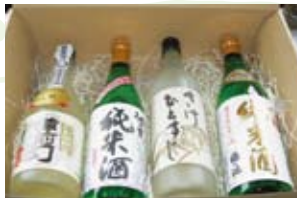
酒蔵の地酒4本セット