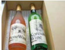
地ワイン2本セット