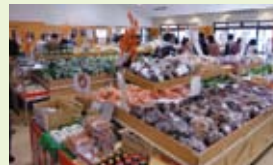
▲「道の駅 久米の里」 野菜がてんこ盛り