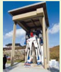
「道の駅 久米の里」 名物！機動戦士ゼータガンダム 身長7メートルのフィギュア