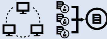
システム等構築費