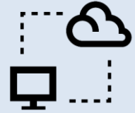
クラウドサービス利用費